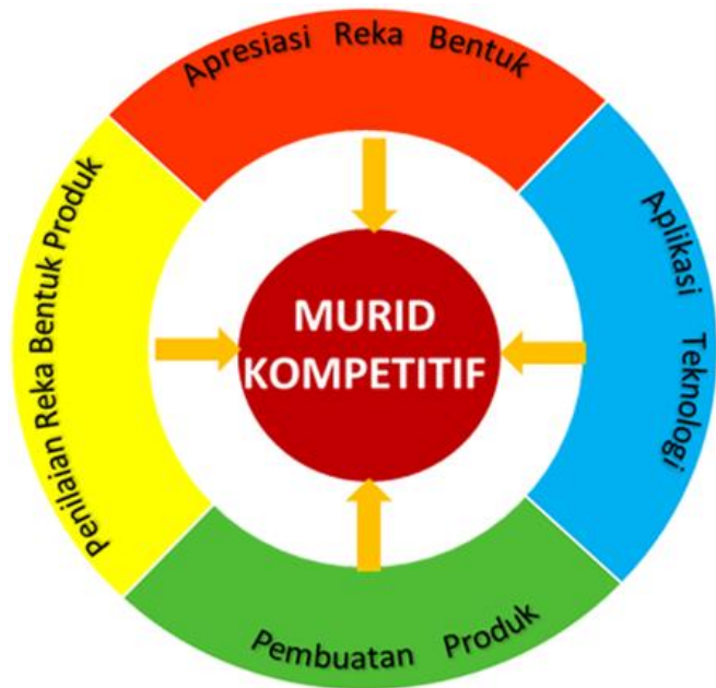
Rajah 2: Domain Reka Bentuk dan Teknologi

KSSR RBT (Semakan 2017) memberi fokus kepada empat domain iaitu apresiasi reka bentuk, aplikasi teknologi, pembuatan produk dan penilaian reka bentuk produk seperti dalam Rajah 2. Murid mengaplikasikan pengetahuan dan kemahiran melalui aktiviti mereka bentuk dan menghasilkan produk yang bermakna. Penerangan setiap domain adalah seperti dalam Jadual 1.